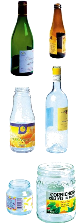
Bouteilles et bocaux en verre