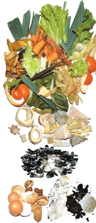
Epluchures et restes de repas